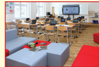
Učebna českého jazyka