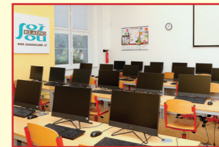
Jedna ze tří počítačových učeben