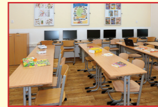
Moderně vybavené učebny