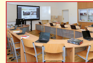
Učebna cizích jazyků