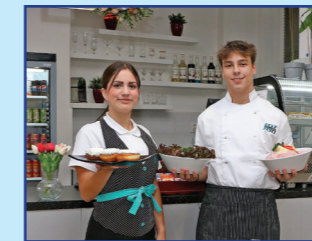
Obsluha ve školní jídelně