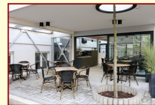
Školní kavárna s terasou