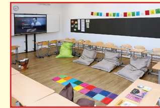
Učebna humanitních odborných předmětů